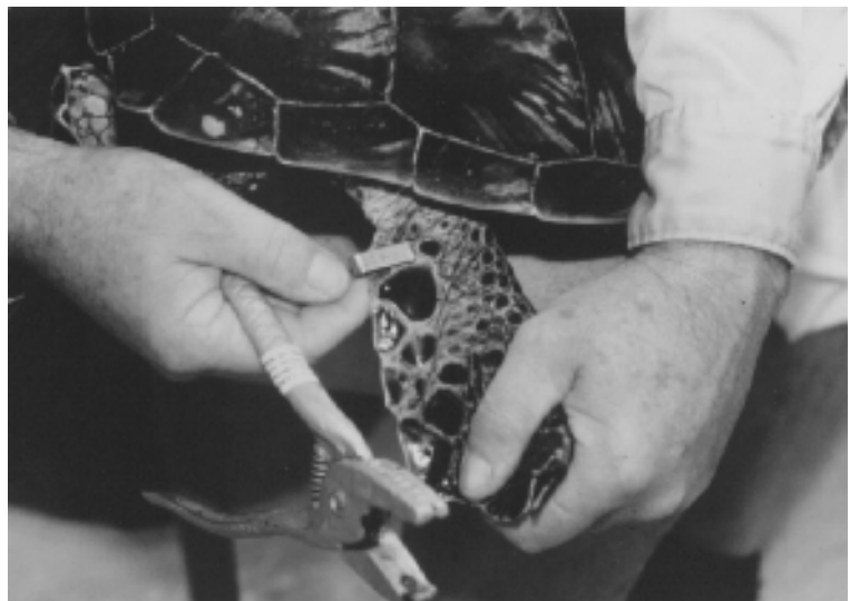
Figura 2. Marca Inconel Modelo 681C aplicada a la aleta posterior de una tortuga verde juvenil. El sitio de punción de la marca es proximal y adyacente a la primera escama grande. Este sitio de marcado parece funcionar bien en hembras anidadoras. El malestar para la tortuga debido a la aplicación de la marca es mucho menor que cuando se aplica a la aleta anterior.